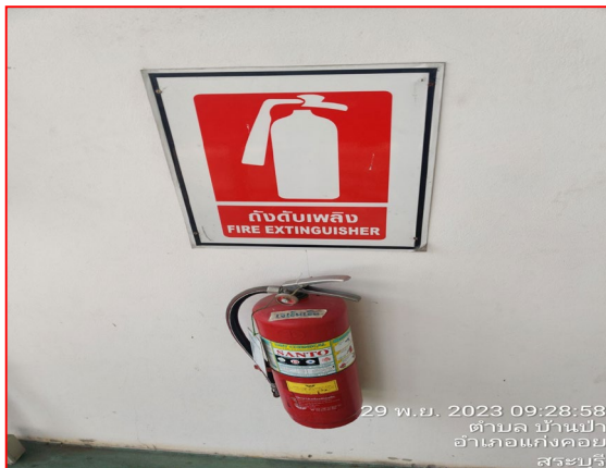
อุปกรณ์ดับเพลิง