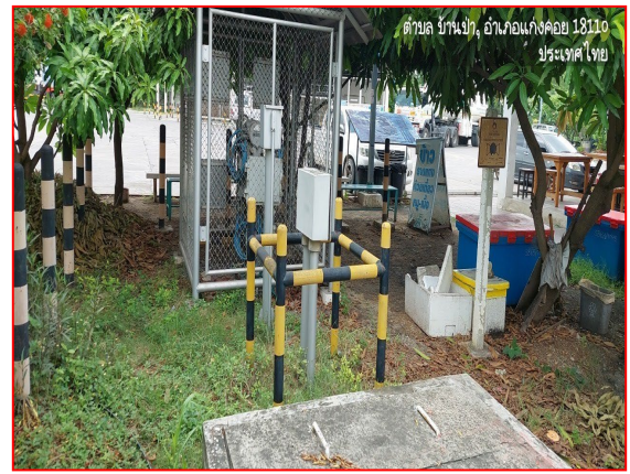
ป้ายเตือนแนวท่อส่งก๊าซฯ