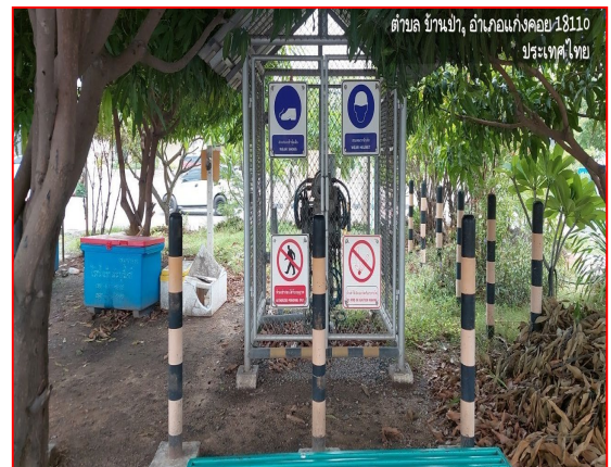
ป้ายเตือนแนวท่อส่งก๊าซฯ

ภาพที่ 3.2-1 ภาพถ่ายระบบรักษาความปลอดภัยบริเวณสถานีก๊าซโครงการท่อส่งก๊าซธรรมชาติไปยังสถานีบริการ NGV ของสมาคมขนส่งทางบกแห่งประเทศไทย พื้นที่ อ.แก่งคุดย จ.สระบุรี