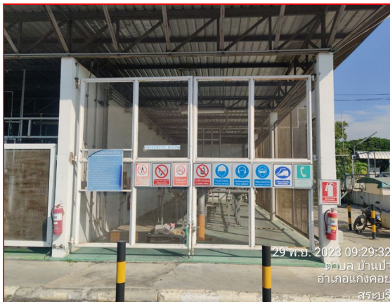
ป้ายเตือนความปลอดภัย